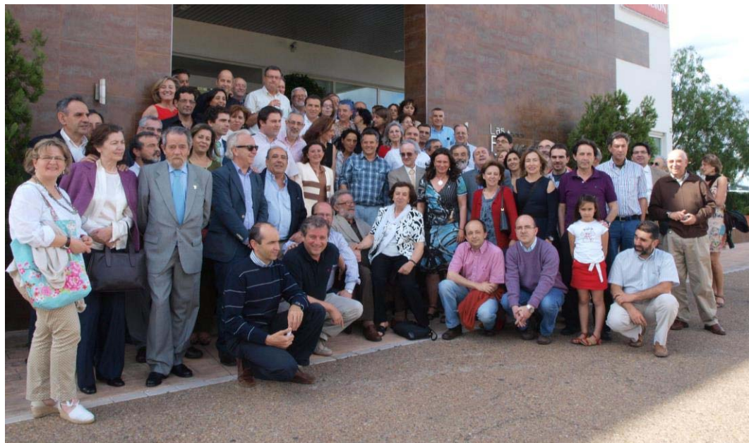
Foto grupo asistente al acto de homenaje